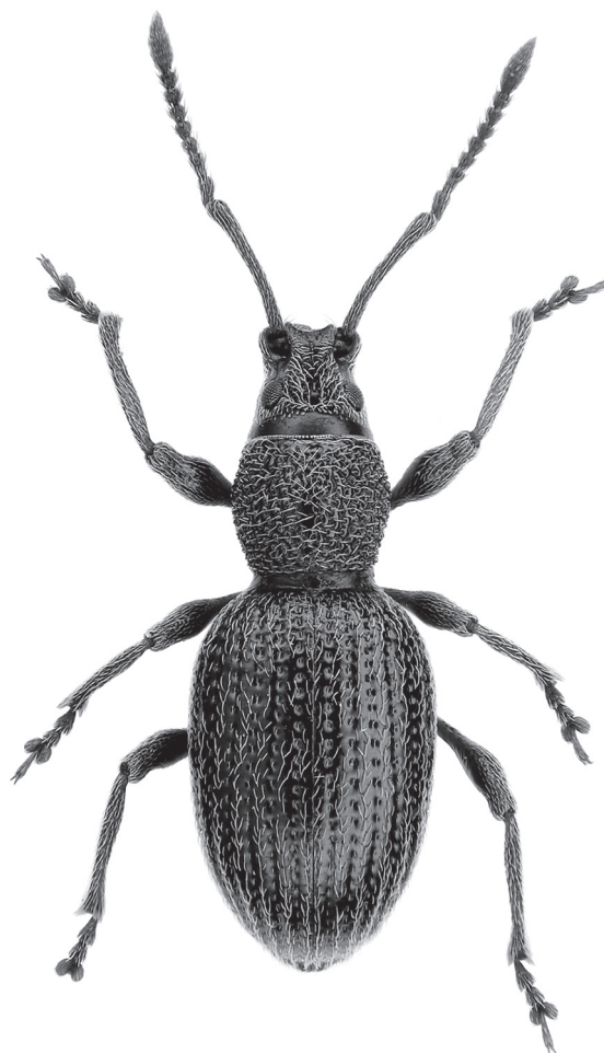
Рис. 1. Otiorhynchus horasanicus sp. n. : габитус голотипа. Fig. 1. Otiorhynchus horasanicus sp. n. : holotype habitus.

Описание. Самка. Тело умеренно сильно удлиненное, темно-коричневого цвета, слабо блестящее. Широкая головная капсула с головотрубкой конусовидно сужены к птеригиям. Голова на уровне глаз слегка шире головотрубки. Головотрубка короткая, поперечная, с довольно сильно выступающими по бокам птеригиями, на уровне птеригий она